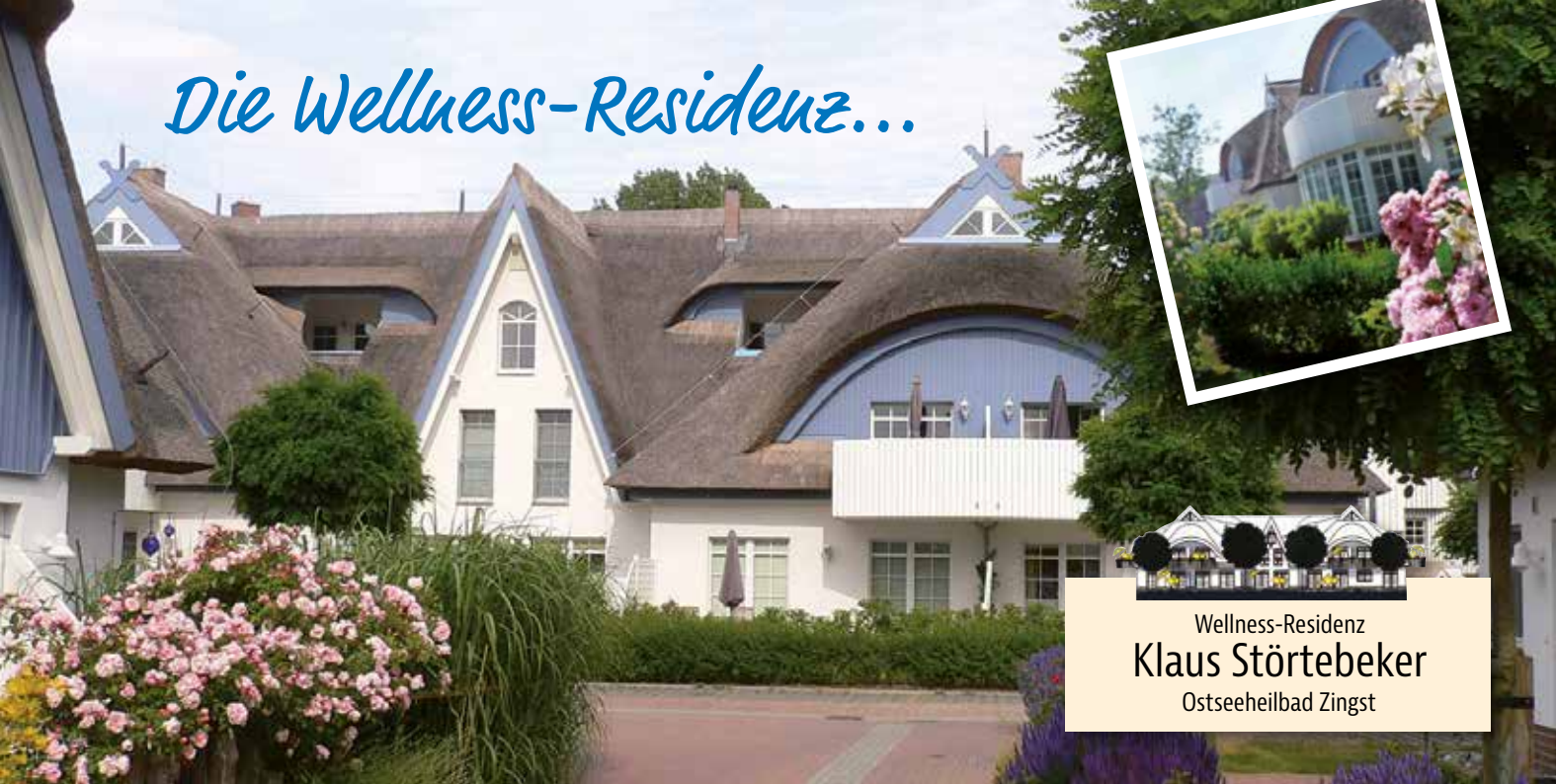
Wellness-Residenz Klaus Störtebeker Ostseeheilbad Zingst

Ein Refugium für Körper und Geist - für Menschen, die Erholung und Wellness genießen wollen.