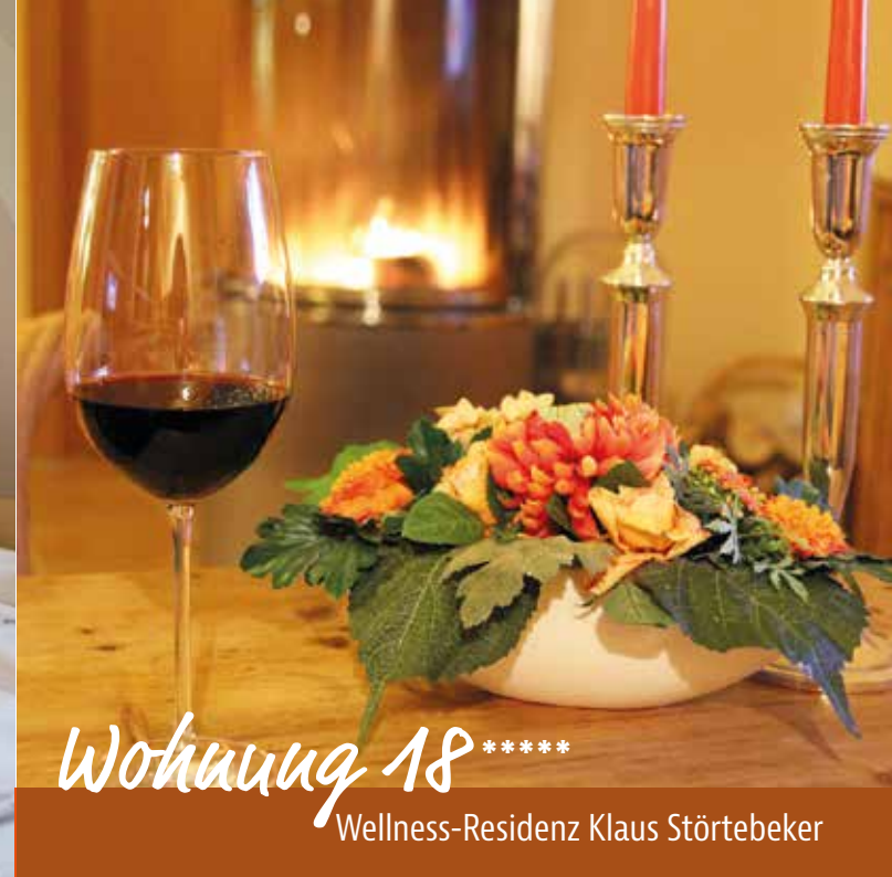
Wohnung 18 ***** Wellness-Residenz Klaus Störtebeker