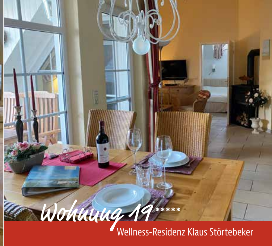
Wohnung 19 ***** Wellness-Residenz Klaus Störtebeker